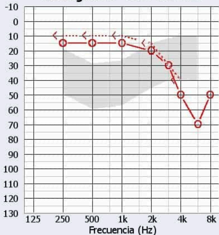
Audiograma - Oído Derecho